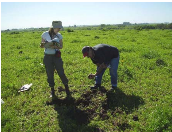
Figura 11. Registro de coordenadas de los materiales recuperados en diario de campo.