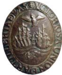
Figura 5. Insignia de bronce de la Unión de Artillería de Buenos Ayres.

El sitio, además de corresponder con las descripciones halladas en los documento, presenta evidencia material relacionada al hecho, especialmente la insignia de la Unión de Artillería de Buenos Aires, y su asociación a elementos bélicos.