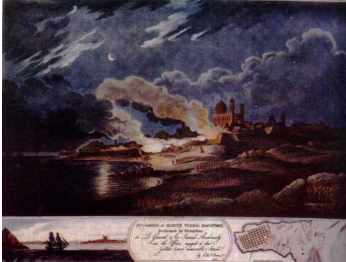
Figura 1. Storming of Monte Video. Feb 3 rd 1807. G. Robinson.