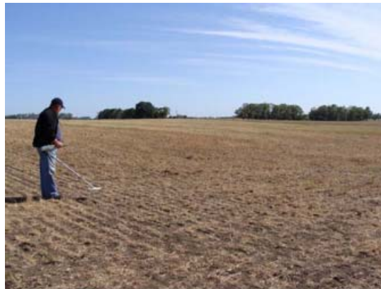
Figura 8. Trabajos por sector y transecta con detector de metales.

Actualmente nos encontramos en la etapa de prospección directa sobre el terreno. Hasta el momento se ha prospectado la lomada de la cota 20 m, mediante transectas paralelas de 10 x 150 m, con la ayuda de un detector de metales. Todo el material localizado ha sido ubicado y mapeado en una ficha de prospección, además de triangulado con GPS, a fin de elaborar un mapa de distribución lo más preciso posible.