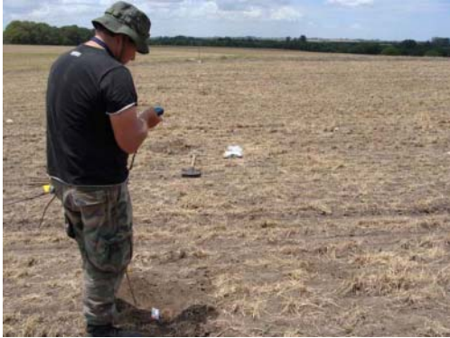
Figura 9. Medición con GPS y señalización de materiales con banderillas previo a su levantamiento.