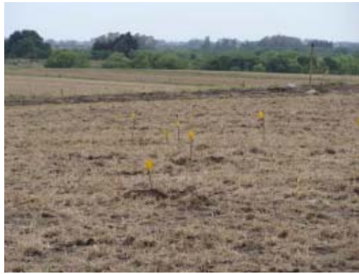
Figura 10. Colocación de banderillas luego de la localización de material arqueológico con detector de metales y su medición.