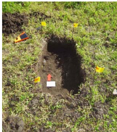
Figuras 14 y 15. Ejecución de sondeos.

Los resultados obtenidos en esta primera prospección apoyan la hipótesis de que el campo de la batalla de San Pedro se ubica en este paraje. El análisis primario de distribución de los materiales nos aporta valiosa información respecto a la ubicación de las tropas. La acumulación de municiones de plomo, balas de cañón y fragmentos de obuses en este sector de la lomada probablemente corresponde con el emplazamiento de las fuerzas españolas.