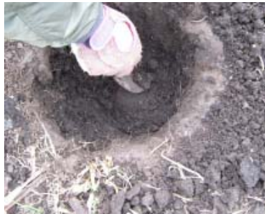
Figuras 12 y 13. Ubicación de material arqueológico del enfrentamiento (fragmento de granada de obús) mediante detector de metales y su recuperación.