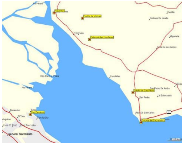
Figura 2. Carta base MapSource con las localidades en que se asentaron los ejércitos antes y después de la batalla de San Pedro.

la Calera de las Huérfanas, recompone sus fuerzas y solicita apoyo a Buenos Aires. Liniers le envía patricios y húsares al mando del teniente de navío José Corcuera.